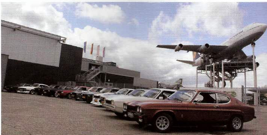
Jaarlijkse bezoeken aan buitenlandse evenementen, zoals de grootste Europese meeting in Speyer