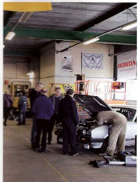
Altijd gezellig druk op de Sleuteldag in Almere; 13 april is de volgende

leden nu veel meer service en plezier bieden voor hun - al jaren niet meer gestegen - contributie. Ze ontvangen elke twee maanden een prachtig clubblad in fullcolour, waarbij de redactie een zodanige kopijstroom te verwerken krijgt dat zij regelmatig dingen moet doorschuiven. Per jaar organiseren we vijf, zes evenementen, waaronder sleutelmeetings en een drukbezochte ledenvergadering, doordat we die combineren met een bezoek aan een automuseum. Voor een vacante bestuursfunctie meldden zich onlangs vier kandidaten, dat zegt wel wat over de betrokkenheid. Hoe we dat voor elkaar krijgen? We hebben een heel platte organisatie, waarin iedereen voor elkaar klaarstaat. Bovendien geven we bij een vacature precies aan wat we van de vrijwilliger verwachten. Vele handen maken licht werk, is onze insteek."